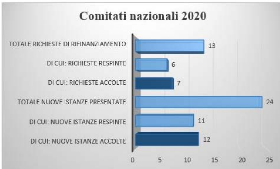
Fig. 3. Comitati nazionali 2020: rifinanziamenti e nuove richieste

Delle 4 nuove richieste di edizioni nazionali, la Consulta ha deciso di non procedere ad istituire nessuna nuova edizione nazionale , con le motivazioni indicate.