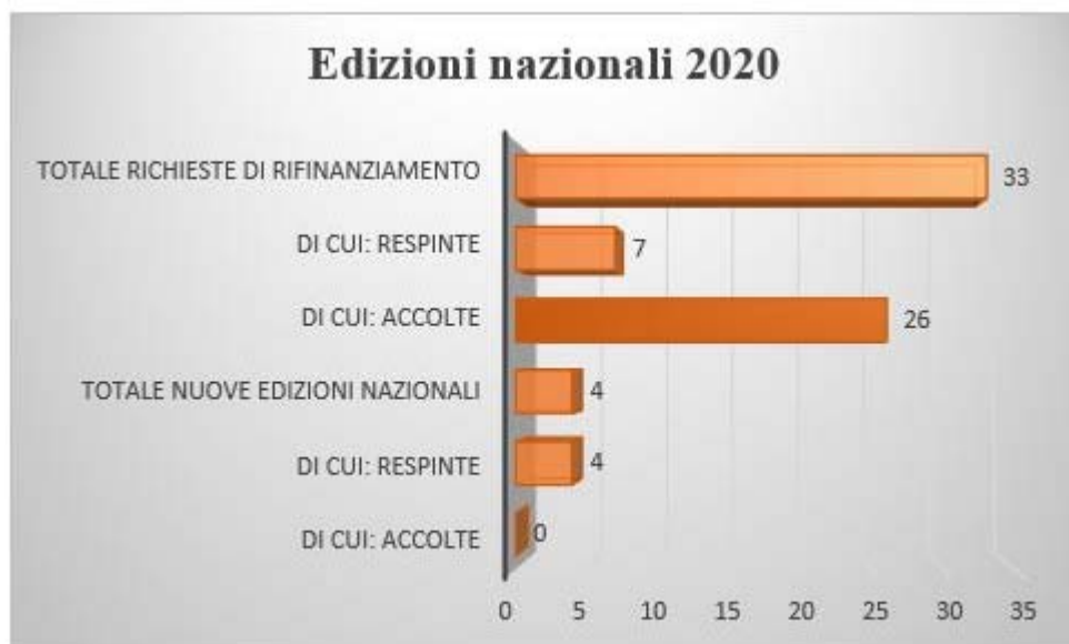
Fig.4. Edizioni nazionali 2020: rifinanziamenti e nuove richieste