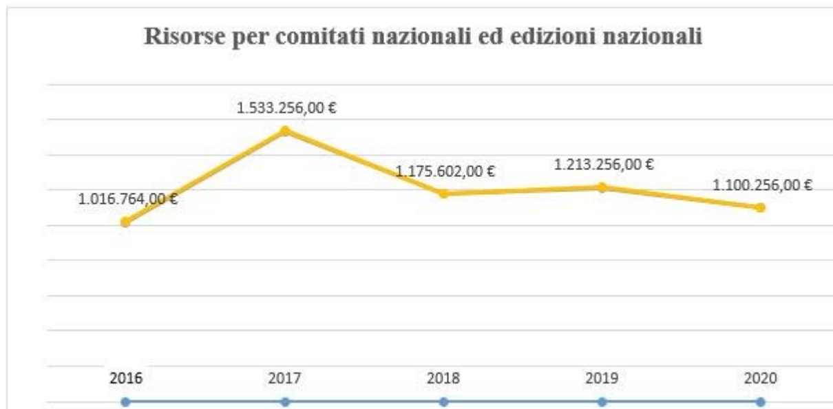
Fig.1. Andamento delle risorse 2016-2020. Fonte MIBACT

Le risorse sono così suddivise: ai comitati nazionali sono destinati 680.000 euro , di cui 529.000 euro per i nuovi comitati e 151.000 euro per i comitati già operanti; alle edizioni nazionali spettano 420.256 euro , interamente destinati ai rifinanziamenti (fig. 2).